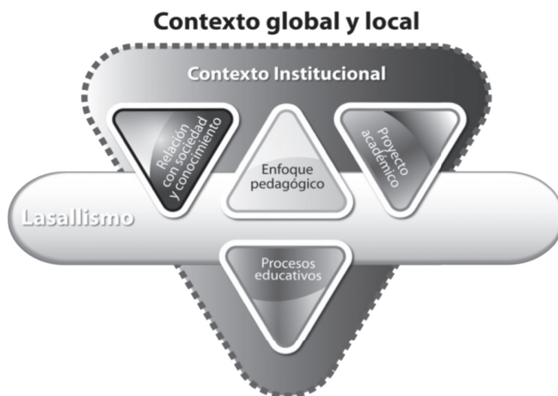
Gráfico 2. Elementos estructurantes del Modelo educativo de la ULSA. Creación de los autores.

Para ello el Modelo educativo integra cuatro elementos estructurantes que le permiten delimitar, fundamentar, planear, orientar y evaluar las políticas, el plan institucional, los proyectos, las estrategias y las acciones que dan cuerpo a sus funciones sustantivas y a la adjetiva, y se materializan en los ejes de gestión. Estos elementos, que moldean a la institución y la guían en su quehacer, son el enfoque pedagógico, la relación con la sociedad y el conocimiento, los procesos educativos y el proyecto académico.