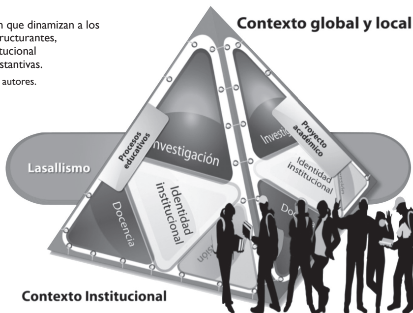
Gráfico 3. Ejes de gestión que dinamizan a los elementos estructurantes, identidad institucional y funciones sustantivas. Creación de los autores.