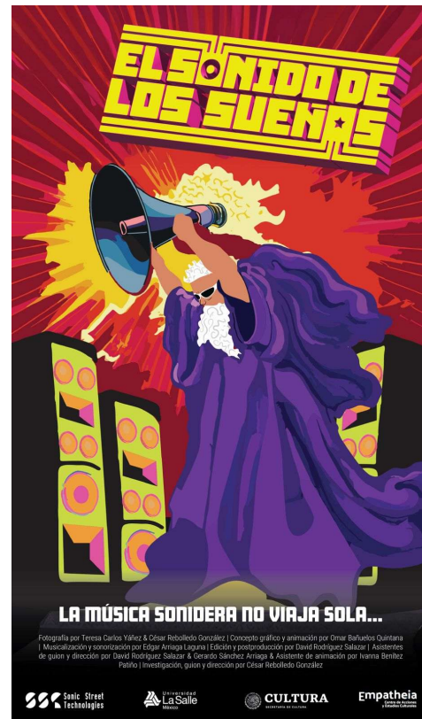
Figura 2. Póster promocional del documental “El Sonido de los Sueños”